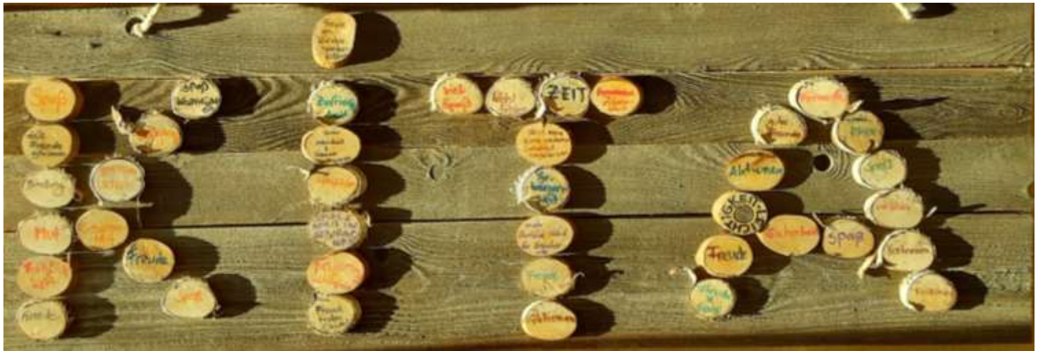
Wünsche der Eltern 2022/2023

Wir sind ein multiprofessionelles Team und wollen uns weiterentwickeln. Deshalb sind wir auf Ihre Meinung angewiesen. Unsere Umfragen werden überwiegend anonym vorgenommen. Diese wird gemeinsam mit dem Träger reflektiert und evaluiert. Ihre Bedürfnisse als Eltern sind uns wichtig und wir wollen diesen, nach Möglichkeit Rechnung tragen.